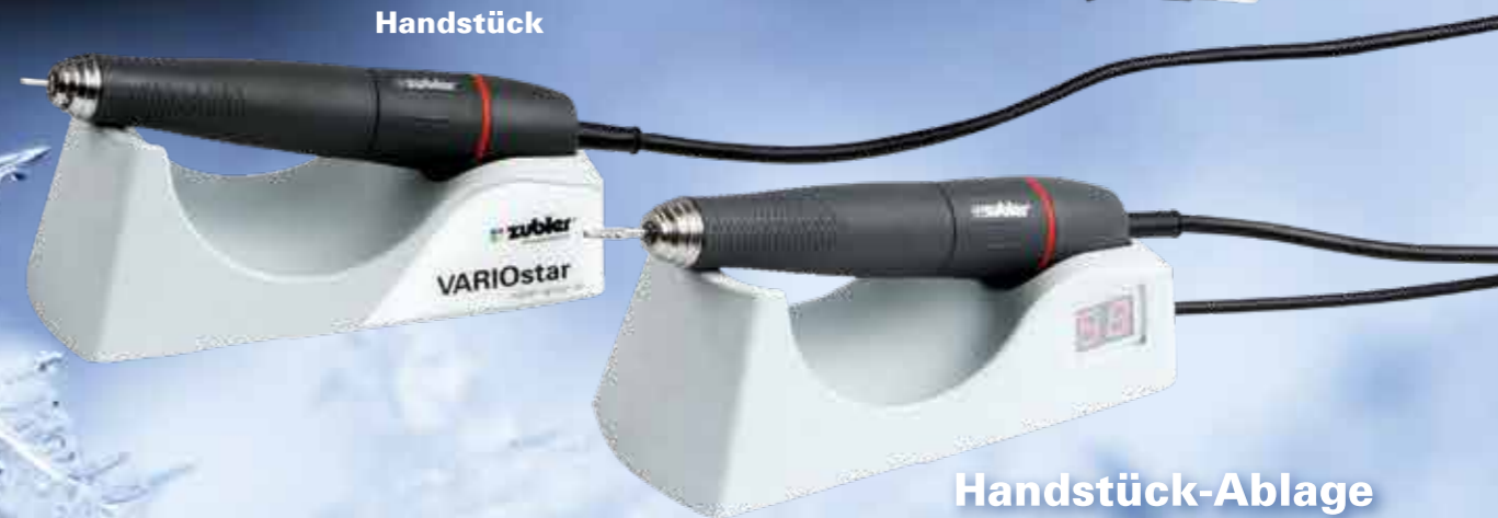
Handstück-Ablage mit digitaler Drehzahlanzeige